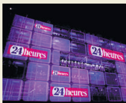
Ce photomontage donne une idée de la taille de la structure.

Il suffit de compléter le questionnaire en ligne figurant sur le site www.24heures.ch/250ans